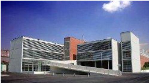
Obrázok 1 Miesto konania kurzu

V dňoch 8. – 11. apríla 2014 sa v Španielsku na katalánskej policajnej škole (Institute for Public Security of Catalonia) uskutočnil tréningový kurz zameraný na boj proti zneužívaniu detí z on-line prostredia s názvom „Child Abuse in Cyberspace“, ktorý pre účastníkov pripravila European Police College CEPOL v spolupráci s Institute for Public Security of Catalonia.