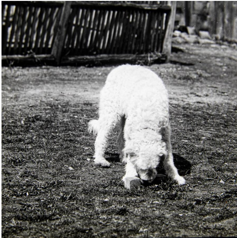
Obr. č. 8: Tatranský čuvač pri aportovacej činke

Na fotografiách je zachytený tatranský čuvač pri vykonávaní cvikov poslušnosti: „Aport“, „Sadni“, „Ľahni“ a „Dlhodobé odloženie na mieste“. Pokus s aportovaním predmetu pôsobí na snímkach nádejne, hoci z fotografie nie je úplne zrejmé, či pes činku skutočne zdvihol a priniesol, alebo ju len uchopil. Pri praktickom výcviku sa totiž môžu vyskytnúť situácie, keď pes k aportu vybehne, dotkne sa ho, no nakoniec ho nezdvihne ani neprinesie psododovi.