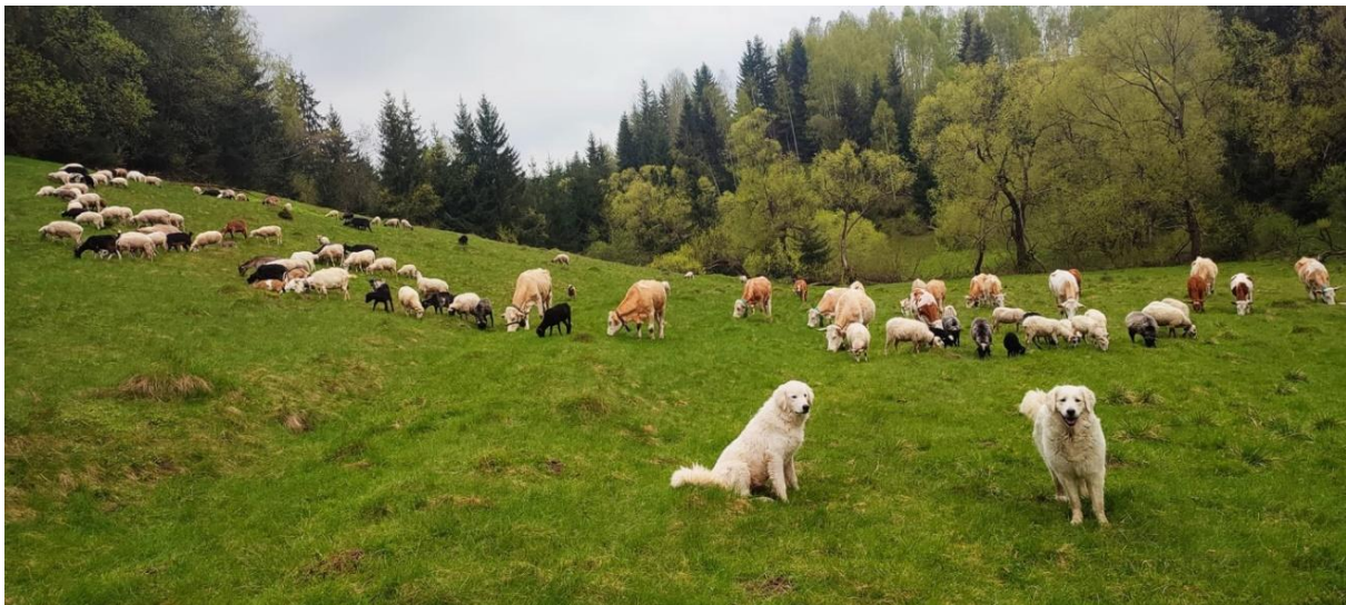
Obr. č. 2: Slovenské čuvače pri strážení rôzneho druhu dobytká

Slovenský čuvač je plemeno uznané Medzinárodnou kynologickou federáciou – Fédération Cynologique Internationale (ďalej len „FCI“) od roku 1965 . Taxonomicky patrí do I. skupiny plemien – ovčiarske a pastierske psy. Ide o psa s pomerne mohutnou telesnou konštrukciou. Výška v kohútiku sa u psov pohybuje od 62 cm do 70 cm, u sučiek od 59 cm do 65 cm. Vrodené povahové vlastnosti, najmä nadpriemerne vyvinutý teritoriálny inštinkt, ho predurčujú na ochranu a stráženie čried dobytká. Rovnako je vhodný na ochranu majetku a príbytkov ľudí venujúcich sa v horských oblastiach hospodárskym činnostiam, chovu oviec, kôz a iným. Je to vytrvalý a pohyblivý pes so súmernou stavbou tela podmieňujúcou uvedené pracovné požiadavky. Je odolný voči extrémom počasia v zimnom aj v letnom období. Jeho hustá srst' s hrubou podsadou je vodoodolná a dobre ho chráni pred výkyvmi počasia Slovenský čuvač je inteligentný, pokojný a sebavedomý pes. Má dobrý vzťah k svojej rodine. Prechováva k nej lásku a oddanosť. Je pevne naviazaný na jedného majiteľa a akákoľvek zmena pána predstavuje pre neho náročnú životnú skúšku.