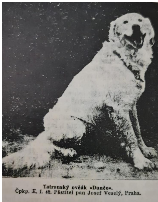
Obr. č. 4: Tatranský ovčiak Dunčo

Pritom tatranského čuvača menovite uverejnili priamo na titulnej strane svojej monografie.