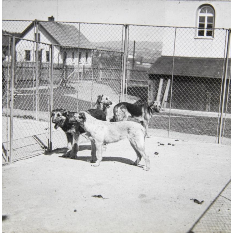
Obr. č. 11: Vo výbehoch pyšelského ústavu sa nachádzali aj rôzne neštandardné typy psov

krížencov s rôznorodým vzhľadom. Dokumentuje aj núdzu o ustálené psie plemená, ktoré by spoľahlivo plnili úlohy bezpečnostného charakteru.