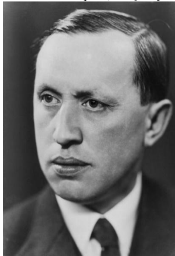
Obr. č. 7: Karel Čapek

Karel Čapek v ďalšom príspevku označil tohto horského psa pojmom fatranský čuvač 17 . Z jeho slov je zrejmé, že názov uvedeného zvierat'a bol odvodený od fatranského pohoria, ktoré je súčasťou Karpát.