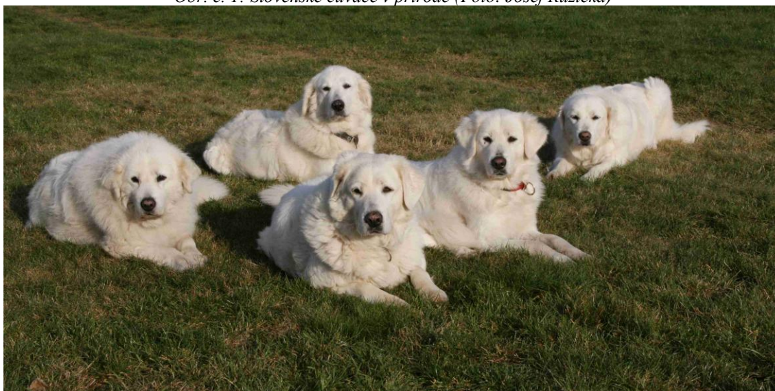
Obr. č. 1: Slovenské čuvače v prírode

Slovenský čuvač je veľký biely pastiersky a strážny pes horského typu. Po stáročia sprevádzal pastierov v oblastiach severovýchodnej časti karpatského masívu. Tento pes sa tradične vyskytoval v regióne Vysokých Tatier, Nízkych Tatier, Malej Fatry a Veľkej Fatry. Bol rozšírený aj v Poloninách, v horách Podkarpatskej Rusi a Beskýd. Do uvedených