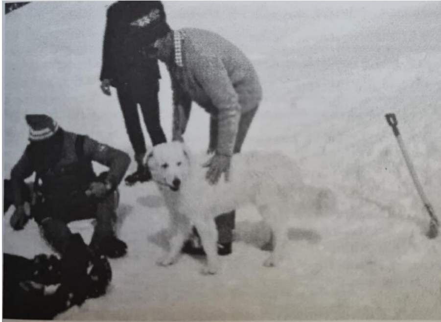
Obr. č. 12: Slovenský čuvač pri lavínovom výcviku.

V roku 1966, rok po medzinárodnom uznaní plemena, si chovatelia stanovili cieľ poskytnúť horskej službe niekoľko slovenských čuvačov na záchranárske účely. Predpokladalo sa, že tieto psy by mohli byť užitočné pri záchrane turistov zasypaných lavínami. Ich telesná konštrukcia im umožňuje vytrvalý klus, pričom silno obrastené laby im zabezpečujú odolnosť aj na zamrznutom snehu. Výhodou slovenských čuvačov sú uzavreté uši a dlhá, hustá srst', ktorá ich chráni pred nepriaznivým počasím. Nevýhodou však môže byť ich biela farba, ktorá sa ťažšie odlišuje od zasneženého prostredia. 19