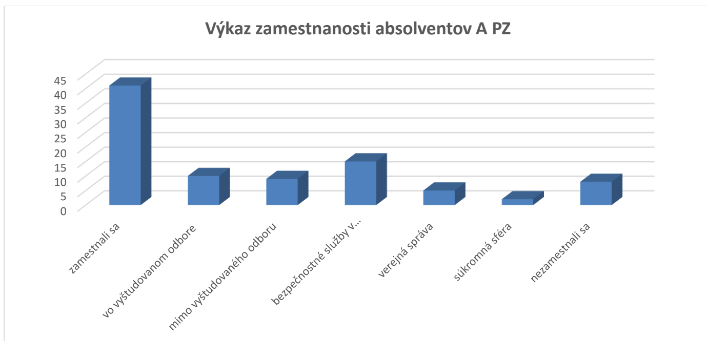
Graf č. 2 Graf zamestnanosti